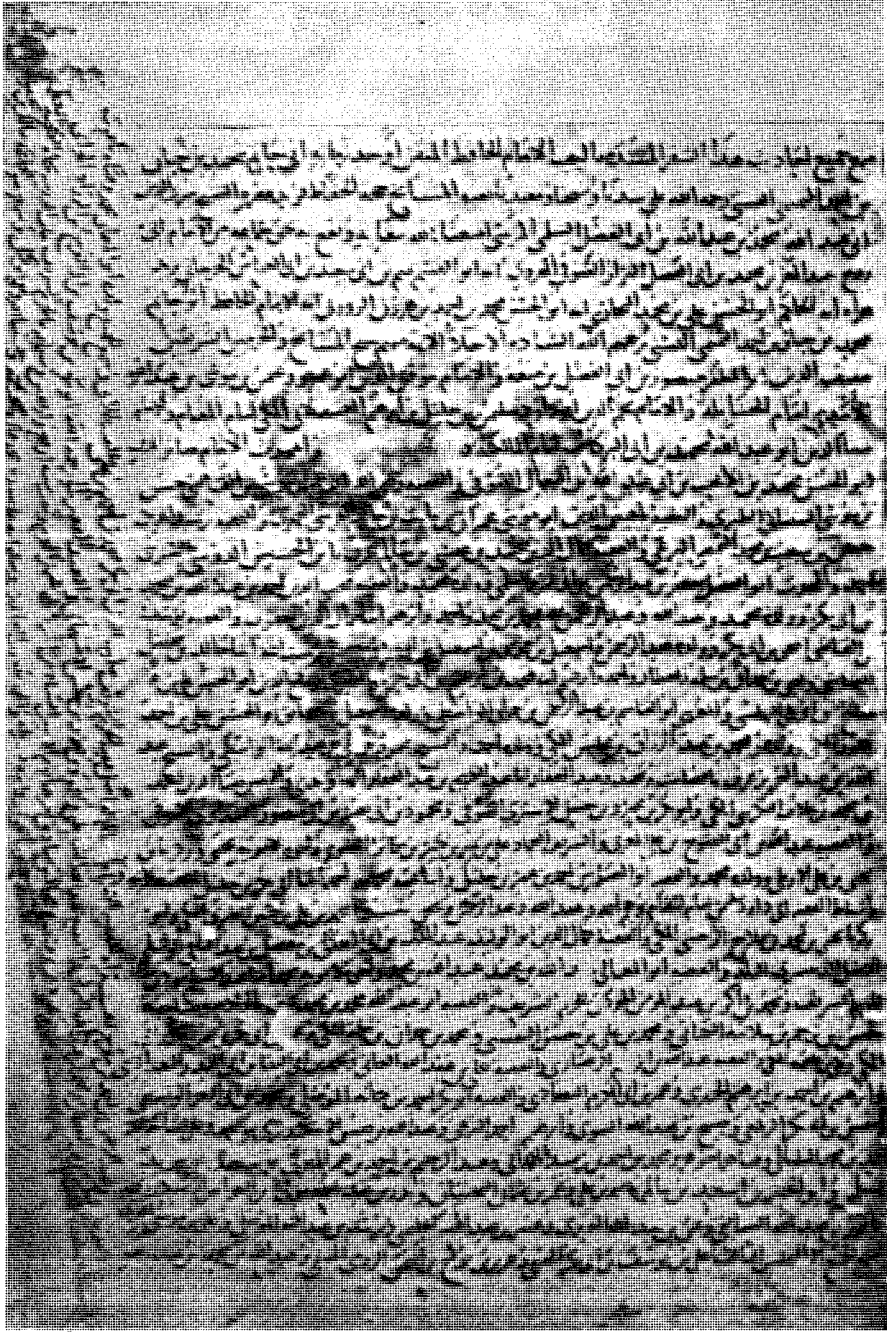
٤ - ثبت سماع المجلد الثالث من النسخة (س) على العلامة شرف الدين السلمي المرسي سنة ٦٤٤ هـ . بقراءة الحافظ قطب الدين القسطلاني الكبير . انظر (ص ٣٤ - ٤٠) . وترجمة القطب القسطلاني (ص ٢٧) .