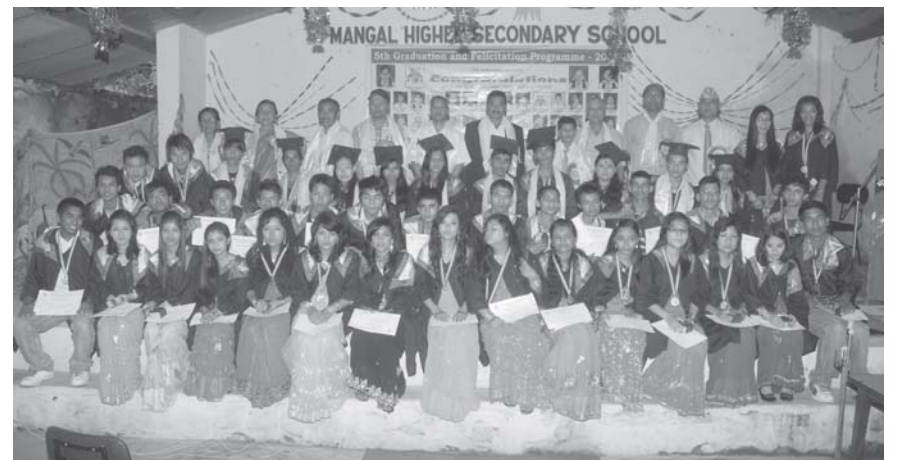
एसएलसी पास विद्यार्थीहरू सम्मान कार्यक्रम पछि सामुहिक फोटो खिचाउँदै