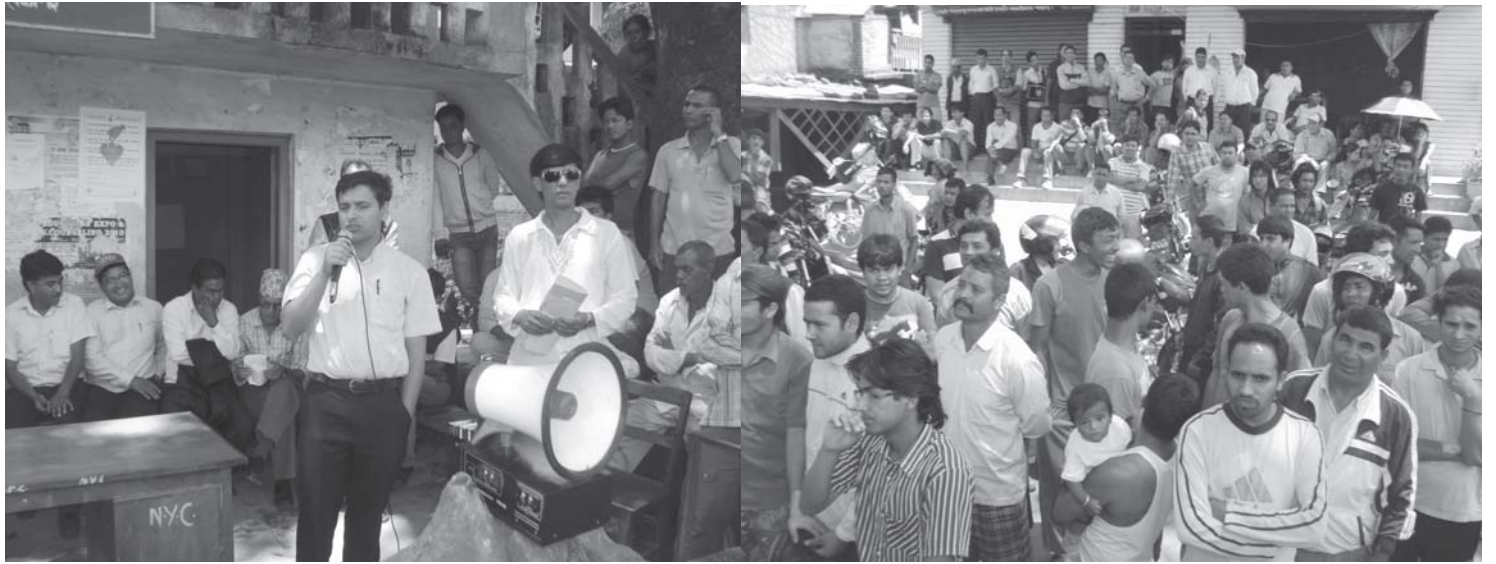
भक्त्यापाटीका स्थानीयवासीको मागप्रति सम्बोधन गर्दै कार्यकारी अधिकृत र सो कार्यक्रममा सहभागी स्थानीयवासी

१२ प्रतिशत प्रोत्साहन भत्ता लिने तर जनताले खोजेको बेला कर्मचारी कार्यालयमा नहुने। कार्यालय समयमा व्यक्तिगत काममा जानेलाई के को तेल खर्च दिने? त्यो पनि दुई महिनाभित्र अनुगमन गरी निर्णय लिने भन्दाभन्दै राजनैतिक संयन्त्रप्रति अविश्वास गरेर अल्टिमेटम दिनु कर्मचारीको गल्लि हो। ११ जना कर्मचारीको सम्बन्धमा पनि प्रकृया पुर्‍याएर स्थायी गर्नु पर्नेलाई