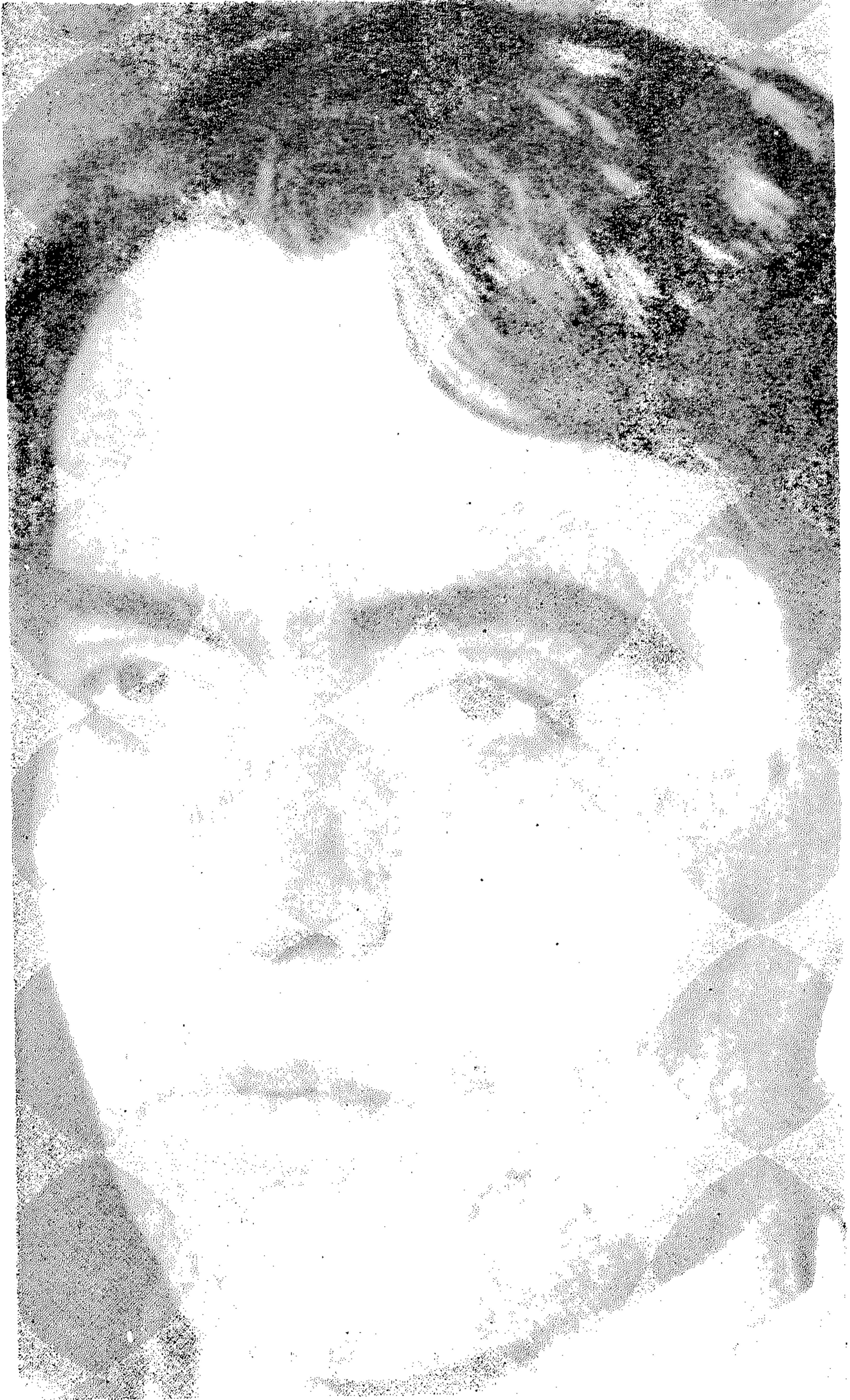
فیدیریکو غار تیا لور کا